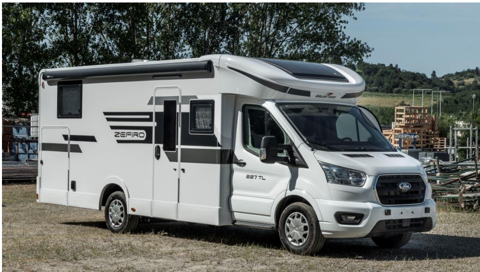
Beispielfoto Zefiro Modell außen